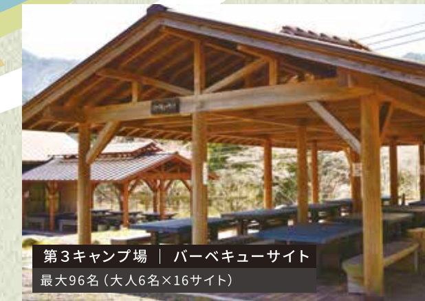
第3キャンプ場 | バーベキューサイト 最大96名(大人6名×16サイト)