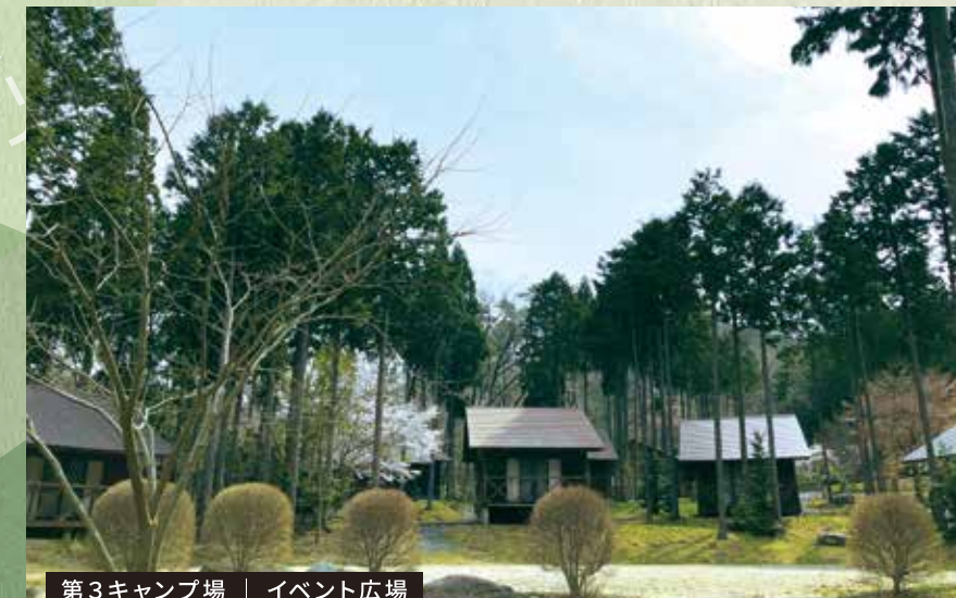
第3キャンプ場 | イベント広場