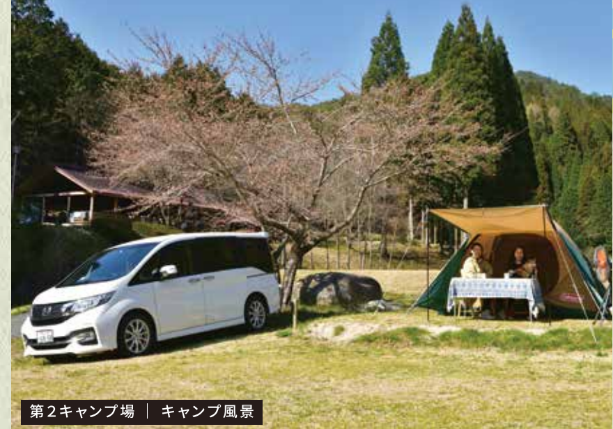
第2キャンプ場 | キャンプ風景