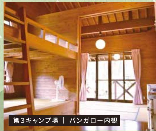
第3キャンプ場 | バンガロー内観