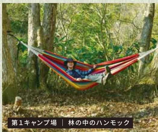
第1キャンプ場 | 林の中のハンモック