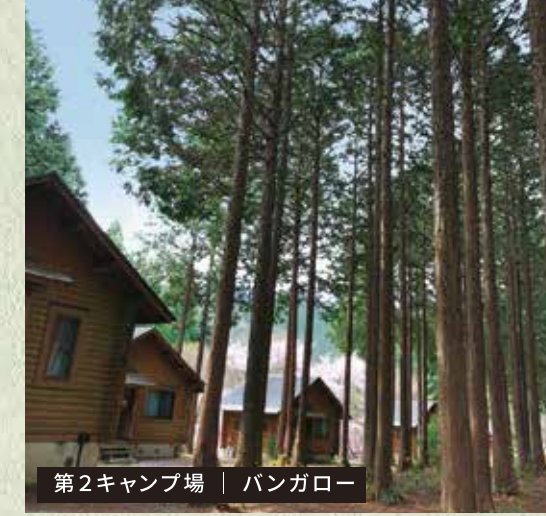
第2キャンプ場 | バンガロー