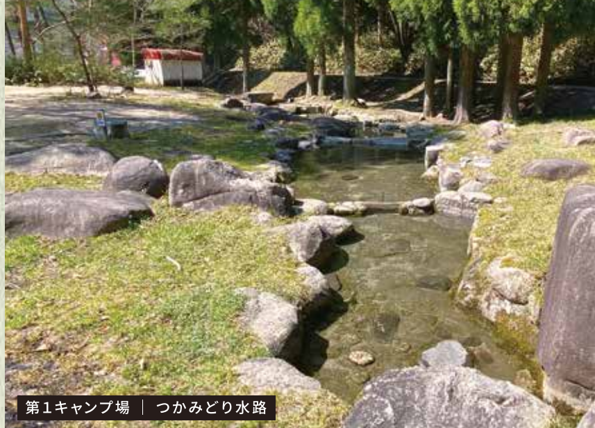
第1キャンプ場 | つかみどり水路